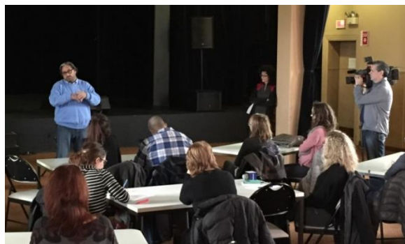
Conférence de presse, Rouyn-Noranda (novembre 2015)