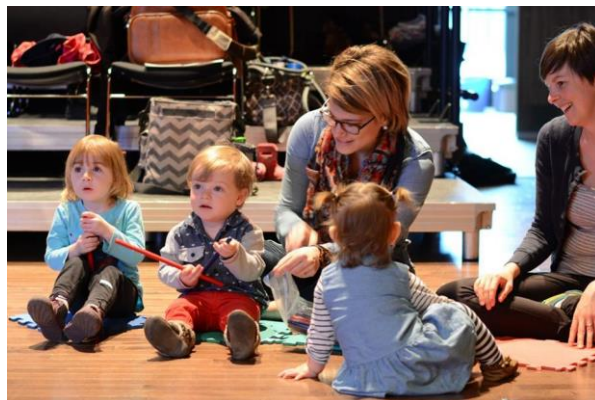
Activité d'éveil à la musique, Val-d'Or (mai 2016)

Lors du Forum sur la citoyenneté culturelle des jeunes , tenu en février 2015, la création d'un réseau de diffusion jeunesse régional est ressortie comme une priorité pour la région. Ainsi, Petits bonheurs Abitibi-Témiscamingue est né du désir de rendre accessible l'art sous toutes ses formes aux tout-petits de 0 à 6 ans. Conscient de l'importance de l'art dans le développement global de l'enfant, Petits bonheurs diffuse et met en valeur des spectacles de qualité ainsi que des ateliers d'expérimentation artistiques destinés à cette jeune clientèle, partout en région!