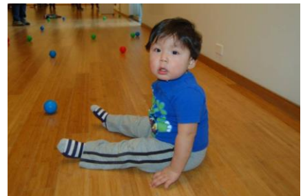
Activités s'étant déroulées lors de la première édition

En tout, ce sont près de 30 activités qui ont pris place. Plusieurs de ces activités ont même fait une tournée régionale et certaines représentations se sont ajoutées face à l'engouement. Ainsi, ce sont plus d'une soixantaine de représentations qui se sont offertes au grand plaisir des enfants, sur tout le territoire. En plus d'avoir des événements se déroulant dans chaque ville-chef des 5 MRC de l'Abitibi-Témiscamingue, Lac-Simon et Pikogan ont également accueilli des activités.