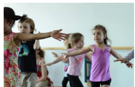
Activités s'étant déroulées lors de la première édition

Respectant les valeurs de Petits bonheurs, l'accès gratuit ou à faible coût était au cœur de préoccupations afin de permettre aux enfants de milieu économiquement plus faible d'assister aux activités. Ainsi, sur l'ensemble des activités planifiées, seulement 13 avaient un coût d'entrée, et ce, de moins de 10 $.